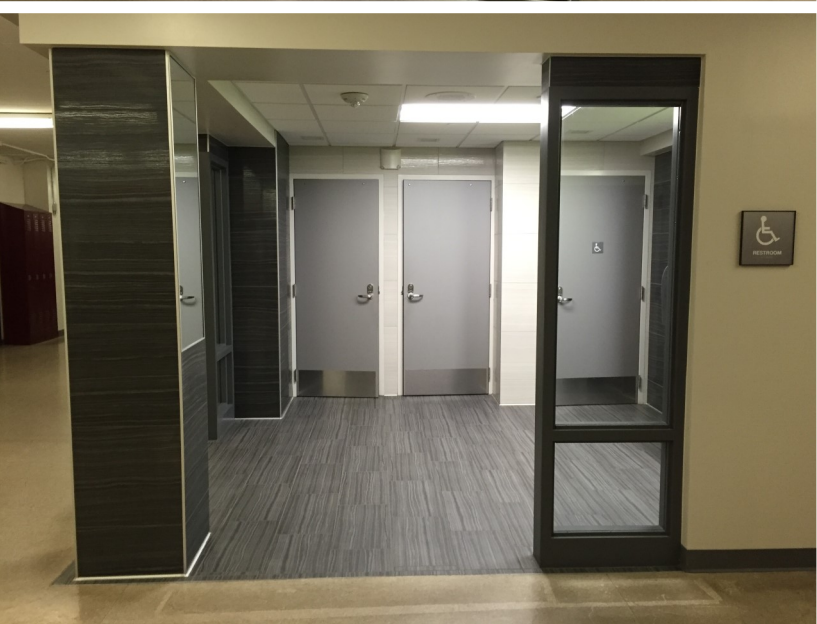
တၢ်ဟးလီၢ်တၢ်ဂီၤတဖၣ်လၢ ကွီၣ်စၢ်န့ၣ်ယၢၣ်တီၤထီၣ်ကွီ (၂၀၁၇)